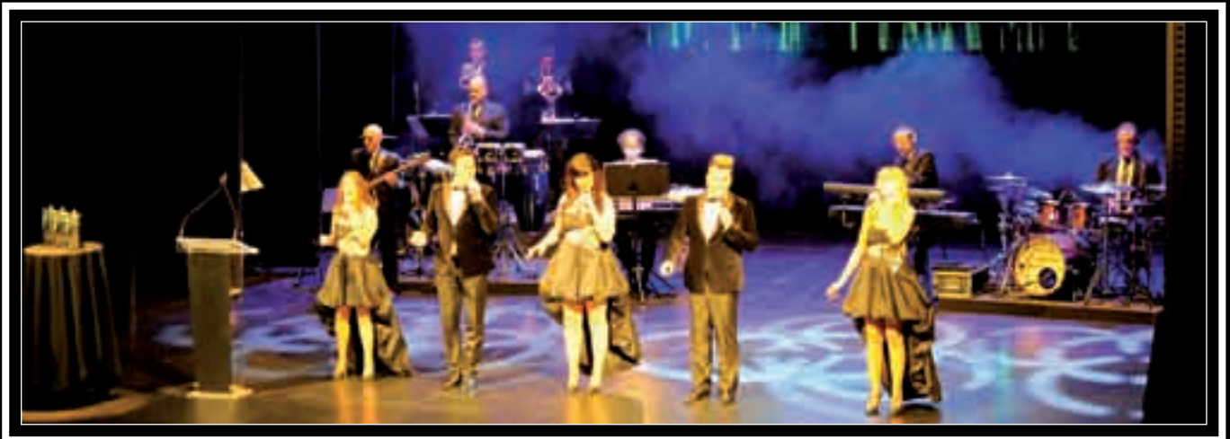
La Dama Orquesta amenizando la Gala.