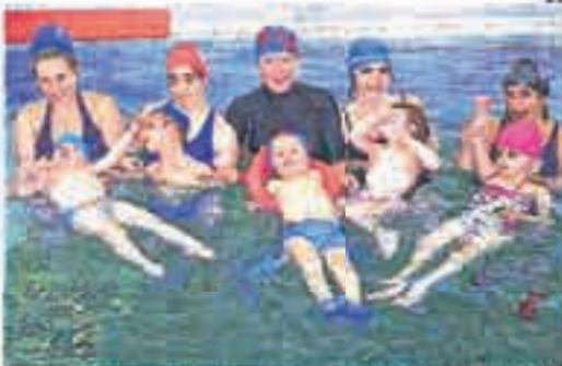
Un equipo de especialistas y terapeutas atiende las necesidades del niño.

En la actualidad, el Aula de 0 a 3 años ha comenzado su tercer curso de andadura, y el centro está muy satisfecho con la gran aceptación que ha tenido tanto por parte