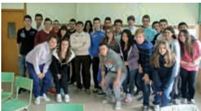
24/02/2014 - La Salle Montemolín