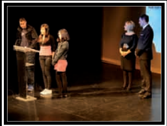
Alumnos del Colegio Cantín y Gamboa, agradeciendo la entrega de material escolar y la visita de Carlos y los jugadores del Real Zaragoza a su Colegio.