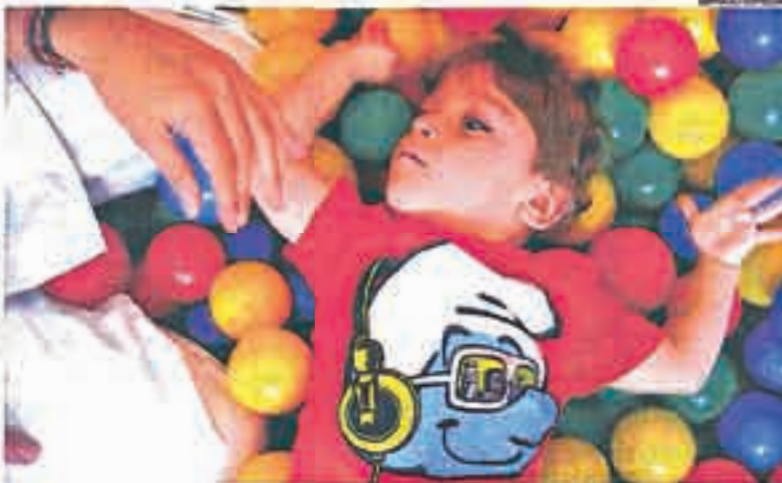
Así pasan niños de 0 a 3 años del Colegio San Germán de la Fundación Aspace Zaragoza.

Eso derivó en la apertura de un Aula de 0 a 3 años (en horario de 10 a 15 horas) en la que se desarrolla un programa de trabajo multidisciplinar estando al frente de la misma una especialista en Pedagogía Terapéutica y contándose, en unos con los servicios de Fisioterapia y Logopedia.