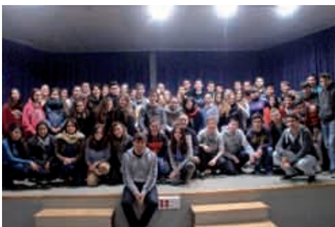
17/02/2013 - IES Pablo Serrano

NUESTRO OBJETIVO PRINCIPAL ES FOMENTAR LA DONACIÓN DE ÓRGANOS A TRAVÉS DEL DEPORTE Y BUSCAR LA REFLEXIÓN SOBRE LOS VALORES QUE PUEDEN AYUDAR A CRECER A LAS PERSONAS, EN ESTE CASO ADOLESCENTES.