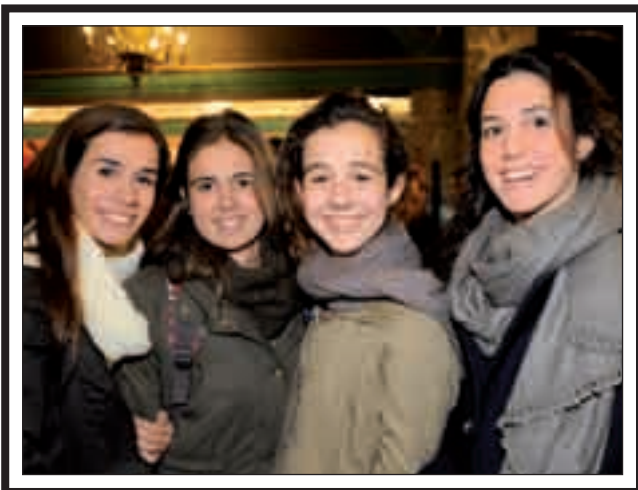
Alumnas del Colegio Sansueña.