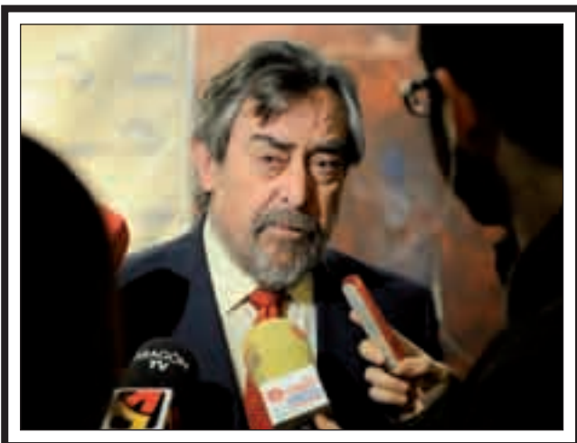
D. Juan Alberto Belloch (Alcalde de Zaragoza) entrevistado