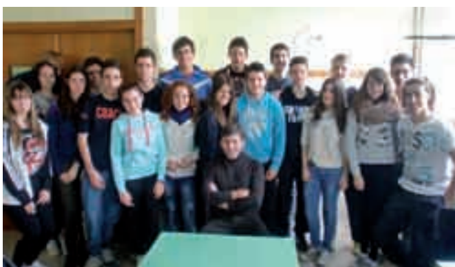
25/02/2014 - Colegio Pompiliano

HABLAR DE VOLUNTAD, EMPATÍA, CONSTANCIA, DECISIÓN... palabras que se hacen obligatorias en nuestro día a día. Para ello, realizamos una tarea divulgativa dirigida a todos los sectores de la población. Centros Educativos, Universidades, Centros Sanitarios y Penitenciarios, así como en el sector empresarial privado. Realizamos charlas-conferencia en las que se cuenta en primera persona la historia de nuestra Fundación y la importancia de la donación de órganos, utilizando como hilo conductor el deporte y los valores como la constancia, el esfuerzo, la capacidad de superación y el trabajo en equipo.