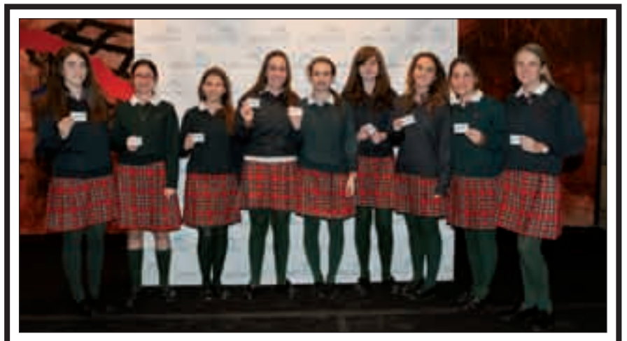
Un grupo de niñas del Colegio Sansueña.