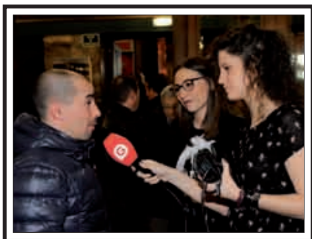
José Antonio López Bueno (Ex campeón mundial de Boxeo) entrevistado